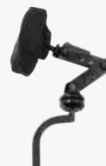
Invacare Huvudstöd Matrix® Elan