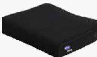
Invacare Sittdyna Matrix® Libra