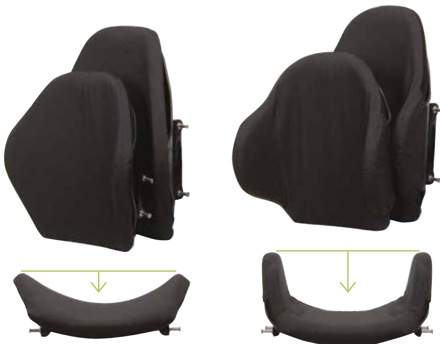
▲ E2 Ryggstöd standard E2 Standard - 8cm Kontur